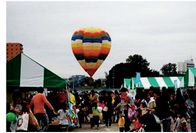
【南区ふるさとふれあいフェア】

ふるさとへの愛着や一体感、区民同士の絆を強め、活発な地域コミュニティを醸成するため身近な緑の創出や区の花「ヒマワリ」の活用、世代の垣根を越えた地域間交流や市民活動の活性化など、区民との協働によるまちづくりを進める必要があります。