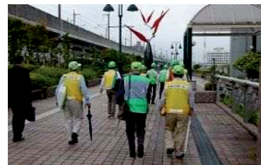
【南区防犯パトロール】

10区の中で2番目に自主防災・防犯組織数が多く防災・防犯意識が高い南区では、安全・安心な地域コミュニティを構築するため、自主防災組織、防犯パトロール協議会、交通安全保護者の会（母の会）南支部等を支援し、更に防災力の向上や防犯、交通安全対策の強化を図っていく必要があります。