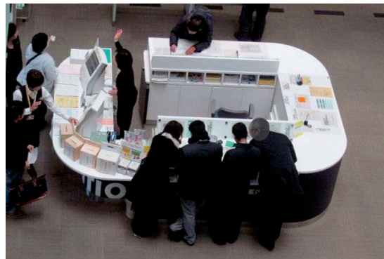
【南区役所総合案内】

来庁者の用件・問合せに関する担当窓口への案内、区民課窓口申請書類の記載方法・申請手順に係る案内、情報公開コーナーにおける行政資料等の閲覧・貸出し及び無償・有償の頒布を行います。