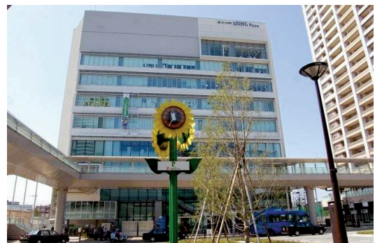
【南区役所(サウスピア4階～7階)】

区役所の連絡調整や事務遂行に当たり、必要な庶務(旅費の支給や消耗品の購入等)を行います。